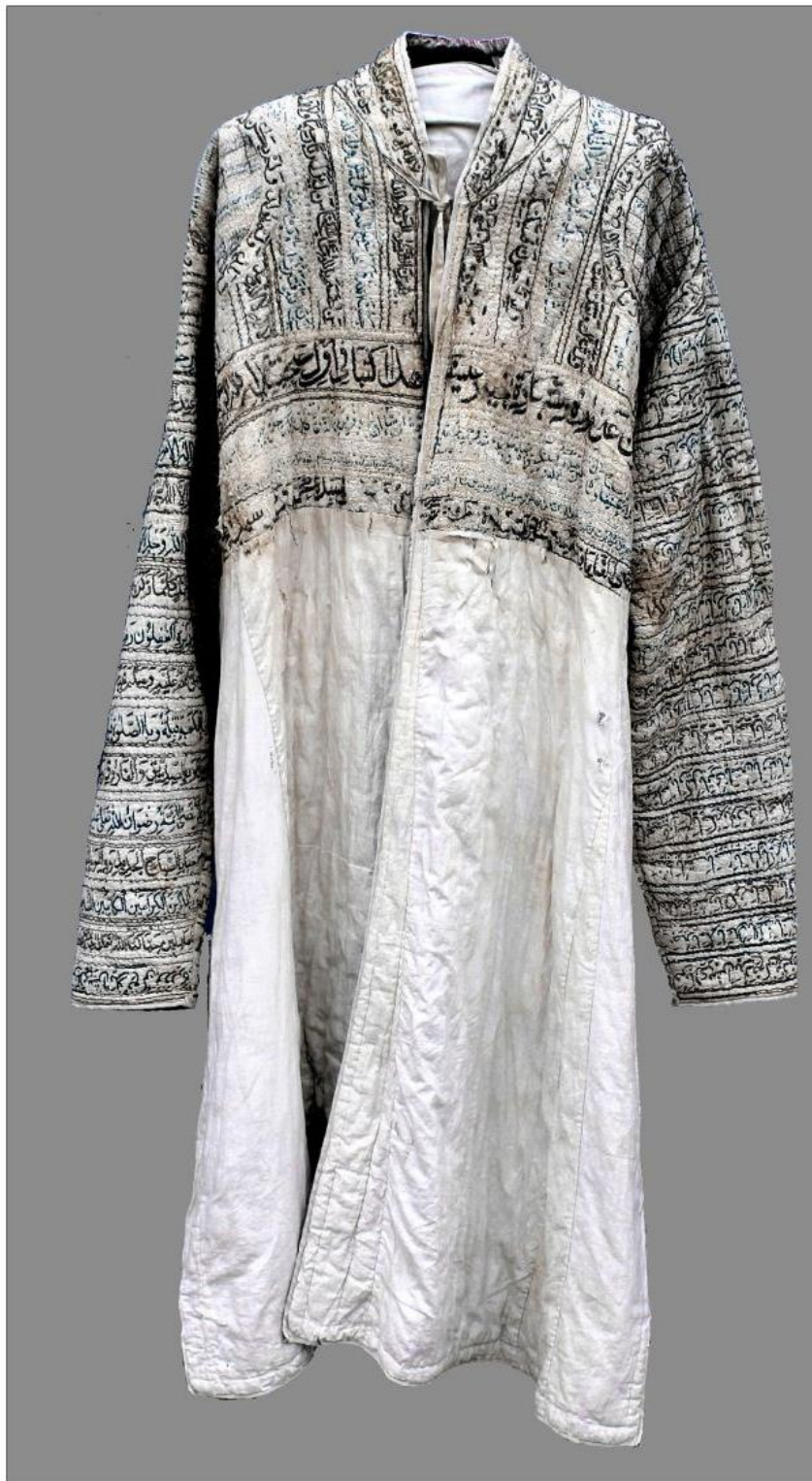
ERKAKLAR CHAPONI МУЖСКОЙ ХАЛАТ MEN'S COAT